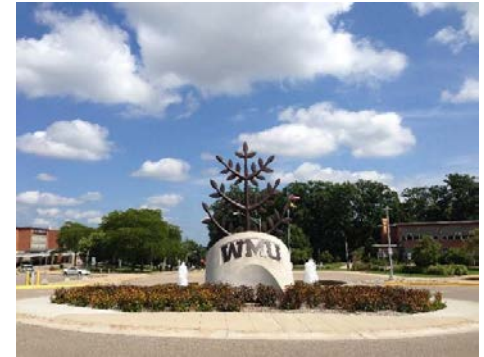
Western Michigan University, USA