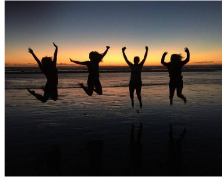
Chapel Hill, North Carolina